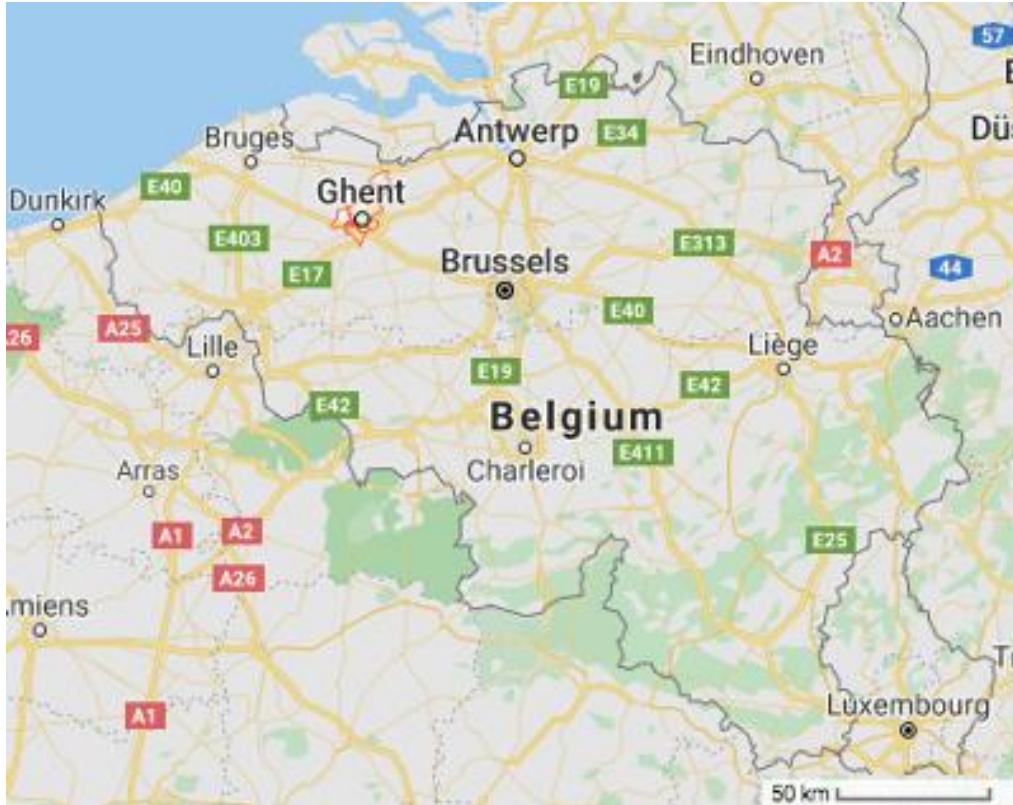
Kaart 1. Gent 1