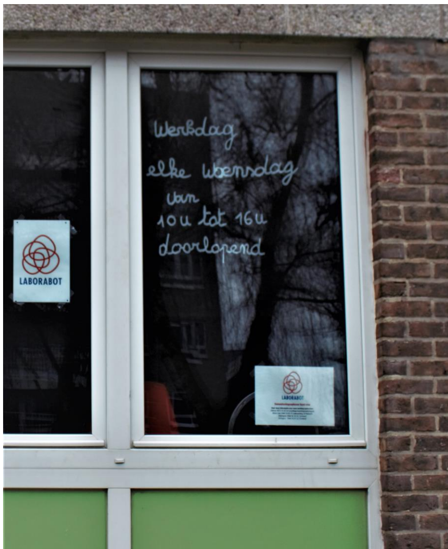
Buitenkant van raam van het Laborabotkantoor met werktijden 53

De combinatie van het hebben van een werkplek om actief te zijn en het krijgen van een waardering hiervoor, relateren de vrijwilligers aan het hebben van ‘werk’, en verklaart waarom zij spreken van “ik ga naar mijn werk” 54 . Wat dit ter discussie stelt is het label dat men toegeschreven kan krijgen wanneer je geen onderdeel uitmaakt van de arbeidsmarkt: men is bijvoorbeeld arbeidsongeschikt of werkloos, terwijl een aantal vrijwilligers laten zien dat zij een bijdrage leveren op hun eigen manier, in hun eigen werk. Voor hen is het krijgen van een waardering een erkenning dat hun bijdrage ook nut heeft, net zoals het heersende idee van het belang van regulier werk in de huidige