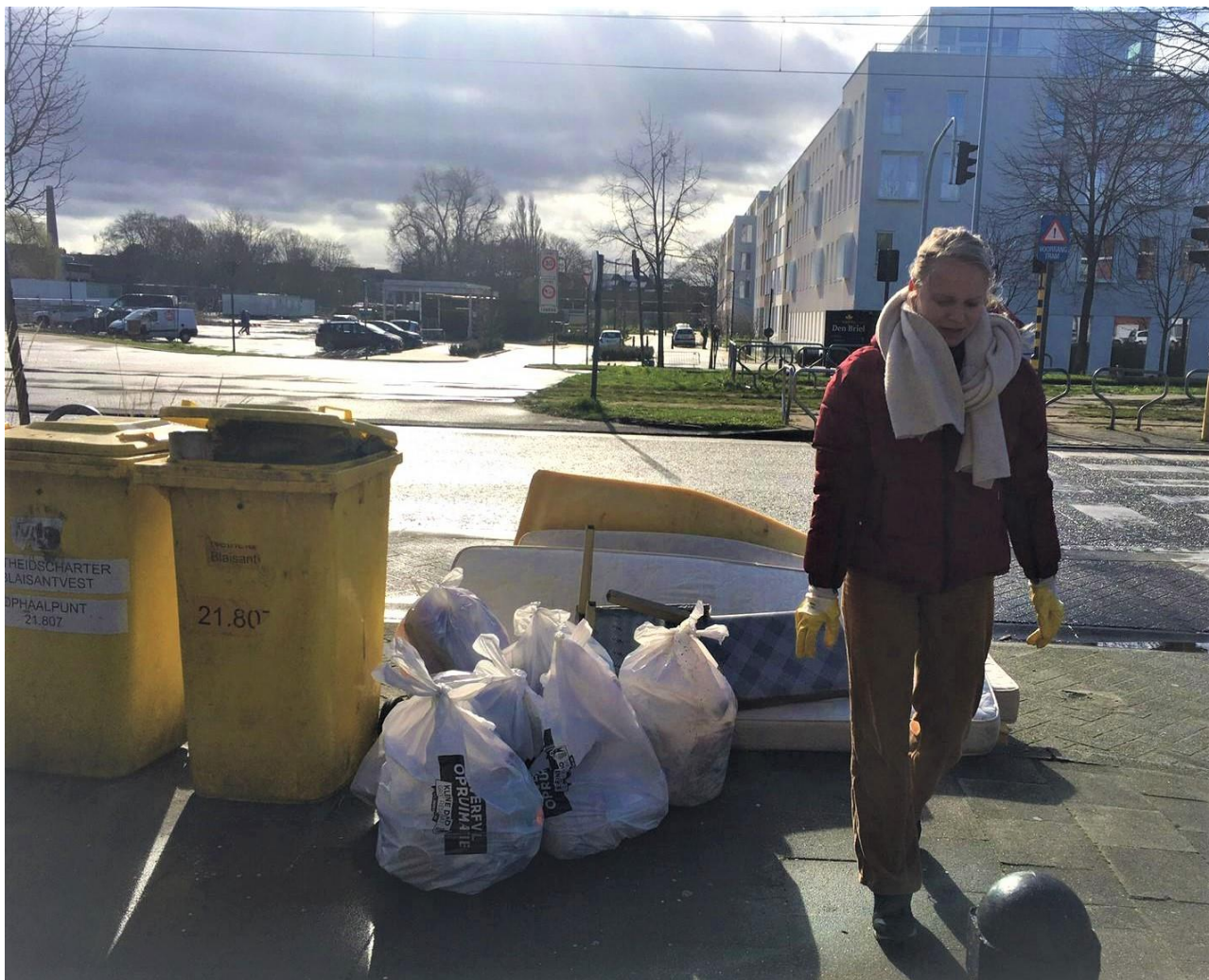
Resultaat Plezante Doeners 27

kijk ernaar en stop ze in mijn zak, trots op de 2,50 euro aan Torekes die ik heb verdiend. De gezelligheid in combinatie met de munt zorgt ervoor dat ik volgende maand weer wil komen helpen. 26