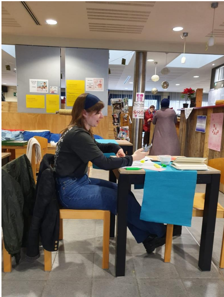
Zitgedeelte in Bar Bazaar 14