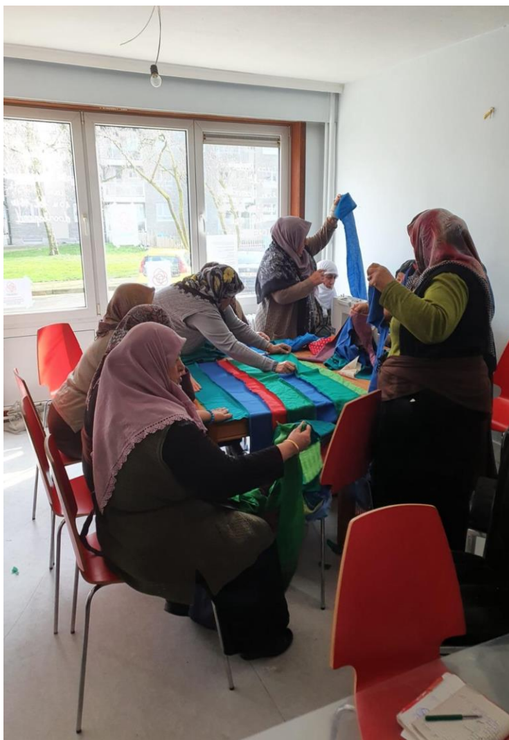
Werkende vrouwen in het naaiatelier 79

Het naaiatelier is een goed voorbeeld van een initiatief waarbinnen bonding sterk is. Bonding , zoals Putnam (2000) een sterkere relatie tussen mensen uit een homogene groep noemt, wordt op deze manier gestimuleerd. De vrouwen spreken allemaal Turks met elkaar en met de leidinggevende van Samenlevingsopbouw. Wanneer bonding sterk is, kan dit zorgen voor uitsluiting van andersgestemden (Putnam 2000). Hoewel het voor ons, als buitenstaande onderzoekers, soms moeilijk was om echt te participeren, werden wij wel met open armen ontvangen. Daarnaast was