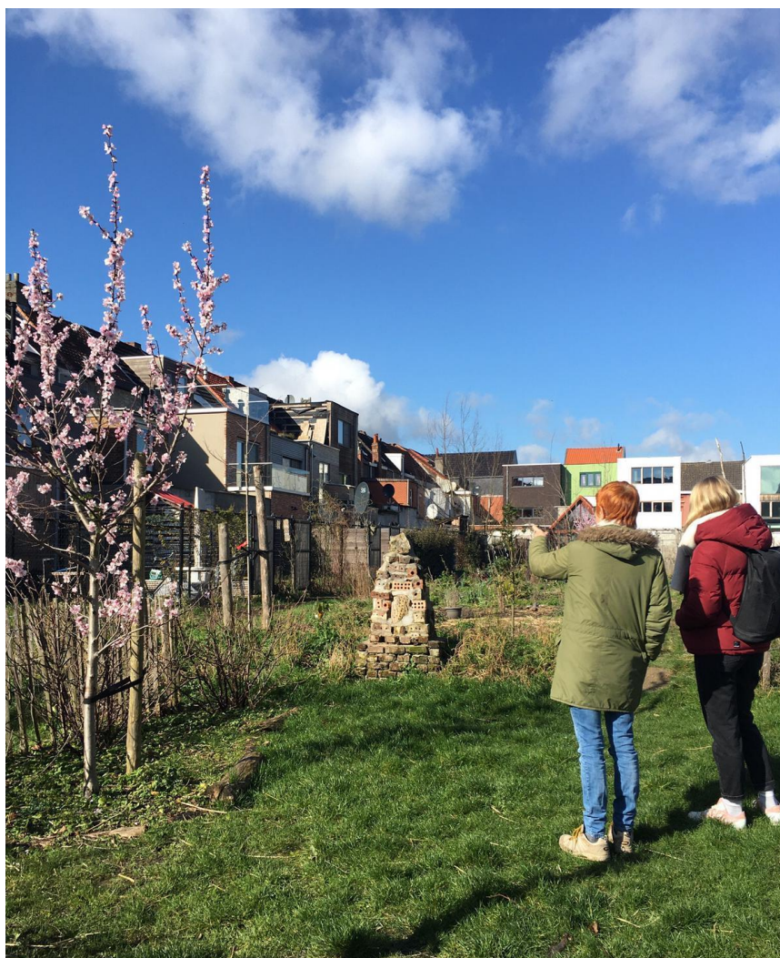
Rondleiding door het Boerenhof 88